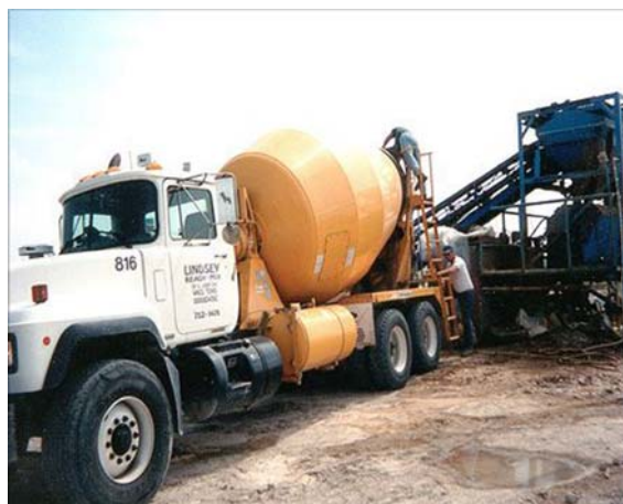
INYECCIÓN DE LA ESPUMA LITEBUILT® EN EL CAMIÓN MEZCLADOR

Debido a la matriz ligera formada por la mezcla de cemento, agua y espuma, se pueden utilizar agregados livianos sin que tiendan a flotar cuando se hace vibrar la mezcla. Algunos de los agregados típicos que se utilizan son: arcilla o pizarra/esquisto expandidos, escorias, pómez, vermiculita o polvillo de cenizas. La inclusión de estos materiales sólo se recomienda si están disponibles localmente, ya que su obtención de lejos a menudo resulta en un costo superior del producto final. Sin embargo, a menudo se recomienda aumentar la densidad general para una resistencia determinada, ya que simplemente un contenido superior de espuma puede brindar mejores resultados.