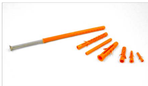
ENCHUFE DE PARED PLASTICO

La mayoría de los fijadores de marco están diseñados como "a través de fijaciones" donde el enchufe de nilón está instalado a través de la base. Las capacidades se diferencian en relación con el poder de agarre, el índice de la extensión y el diámetro. El aumentar el mínimo empotramiento o clavado recomendado por los fabricantes, generalmente no mejora su funcionamiento.