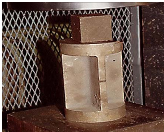
MÁQUINA PARA HACER EL ENSAYO A COMPRESIÓN DEL CONCRETO

Las resistencias a la compresión del Concreto Compuesto Liger y Aireado LITEBUILT® está influenciado por muchos factores, tales como la densidad, la edad, el contenido de humedad, las características físicas y químicas de los materiales componentes y las proporciones de las mezclas, Por ello es aconsejable mantener constantes las proporciones de las mezclas, los tipos de cemento y arena y cualesquier otro material para aumentar el volumen, así como los métodos de producción.