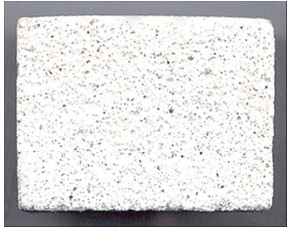
CONCRETO AIREADO LITEBUILT®