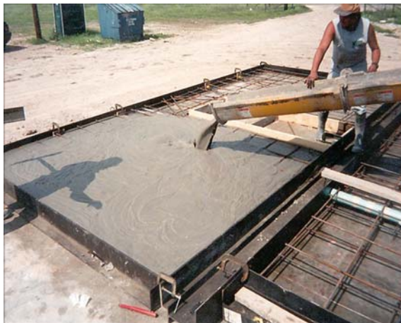
VACIADO DE PANELES LITEBUILT® PARA PLACAS DE CONCRETO

La densidad normal adoptada para este tipo de uso varía entre 1200 \text{ kg/m}^3 (75 lbs/ft 3 ) y 1600 \text{ kg/m}^3 (100 lbs/ft 3 ). La densidad seleccionada generalmente depende de la resistencia necesaria y de las dimensiones (o sea espesor, etc.).