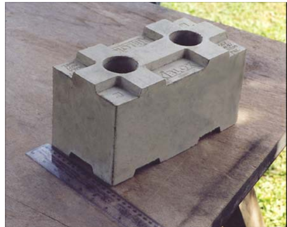
BLOQUE LITEBLOK™ LITEBUILT®

El Concreto Aireado LITEBUILT® es un material ideal para producir bloques livianos de mampostería/albañilería, reduciendo o eliminando la necesidad de curados con autoclaves. La densidad que se emplea varía entre 600 \text{ kg/m}^3 (39 lbs/ft 3 ) y 1100 \text{ kg/m}^3 (69 lbs/ft 3 ) dependiendo de la resistencia mecánica necesaria, o alternatively, de la cantidad deseada de aislamiento térmico (paneles de partición).