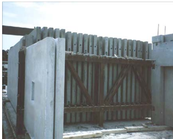
PREPARACIÓN PANELES DE CONCRETO LITEBUILT®

Este es probablemente el método más popular y fácil de curar el concreto. Es un sistema lento pero aceptable que permite una rotación promedio de los moldes cada 24 horas, dependiendo de la temperatura ambiente.