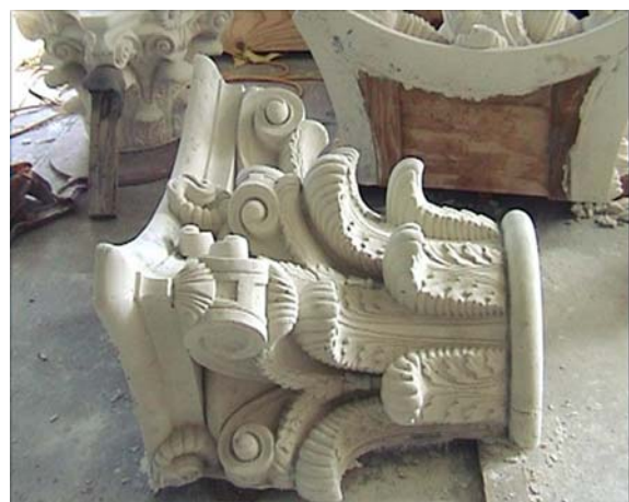
ELEMENTOS ARQUITECTÓNICOS ORNAMENTALES

y especiales de curado. Un curado en humedad tendrá un efecto profundo para aumentar la fuerza compresiva. Para productos como los bloques de construcción de concreto con espuma, se aconseja envolver las paletas con plástico que se pega o se estrecha, asistiendo con ello a retener la humedad por más tiempo. El curado al vapor es otra opción, si el tiempo de curado es crítico.