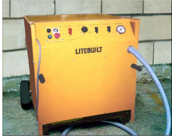
GENERADOR DE ESPUMA LITEBUILT®

El concreto aireado LITEBUILT® se crea incluyendo una multitud de micro burbujas en una mezcla a base de cemento. Esto se logra mezclando el Agente Químico Espumador LITEBUILT® con agua, y generando espuma con la dilución, generalmente utilizando aire comprimido. Para lograr resultados óptimos, se requiere de un Aireador. La espuma se mezcla entonces con la lechada de arena / cemento / agua utilizando instalaciones convencionales para mezclar hormigón, o de concreto premezclado. LITEBUILT® se comporta igual que el concreto denso pesado ordinario en la mayoría de los aspectos, tales como el curado.