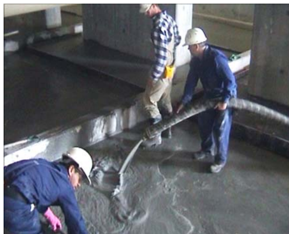
VACIADO DE PISO LIGERO LITEBUILT®

El alto coeficiente de aislamiento térmico del material se hace importante a medida que se ahorra energía reduciendo los requisitos de calefacción y de aire acondicionado, proporcionando mayor comodidad en una amplia gama de condiciones climáticas.