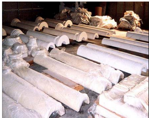
COLUMNAS DE ALBAÑILERIA LITEBUILT®

Se emplean para la fabricación de bloques y paneles precolados/premoldeados para paredes de revestimiento y divisorias, losas para cielos rasos (techos falsos), capas de aislamiento térmico y acústico en edificios residenciales y comerciales de varios pisos. El concreto aireado LITEBUILT® en esta gama de densidades es también ideal para aplicación de relleno densificante.